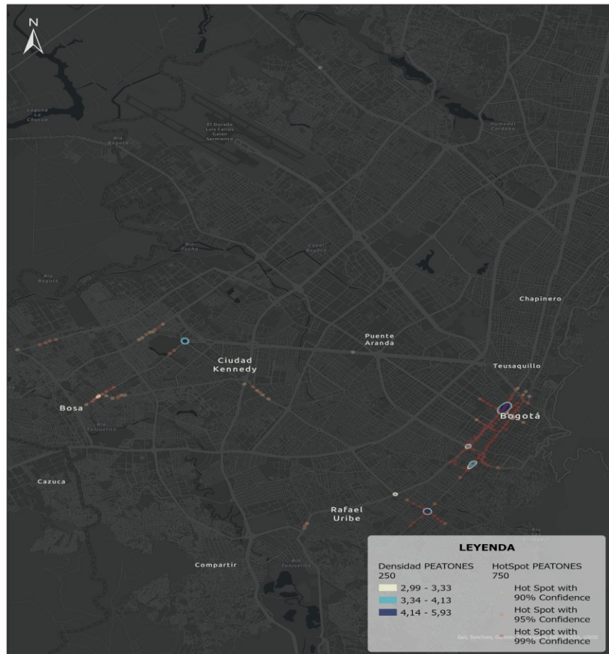
Imagen 1 Ubicaciones críticas por siniestralidad para peatones en vías arteriales